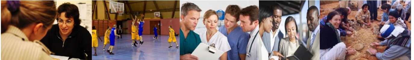
Un cursus pour des acteurs impliqués dans des environnements très variés

Ce cursus permet à chaque stagiaire de revisiter ses choix et ses engagements professionnels et citoyens, d'aller vers plus de profondeur et plus d'impact, d'approfondir et d'intégrer la CNV.